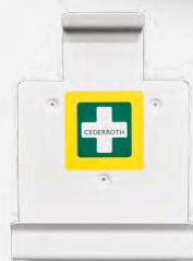
Support mural REF 51000008

Avec les produits de Premiers Secours Cederroth, n'importe qui peut administrer les premiers soins. Les produits sont de conception simple et accompagnés d'instructions claires. Par conséquent, ils peuvent toujours être utilisés par tout le monde, partout, dans toutes les situations.